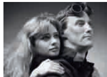
The Unbelievable Truth