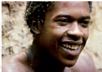
Finyé - Prod DB

Balla Traoré, jeune ingénieur, est révolté par son PDG, Makan Sissoko, indifférent au sort de ses employés. Il décide d'organiser une réunion avec les ouvriers pour faire valoir leurs droits.