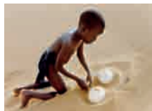
Yeelen, Prod DB © Cissé Films du Carrosse/DR