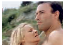
Corps à cœur Prod DB © Diagonale/DR