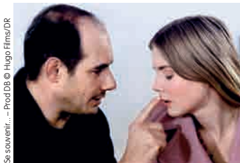
Se souvenir...