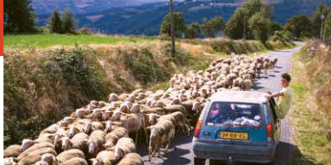
Cowboys Janlen Ook by Mees Peijnenburg (Netherlands – 2013)