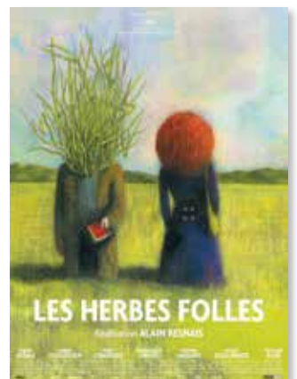
The French movie poster of Wild Grass , 2009.