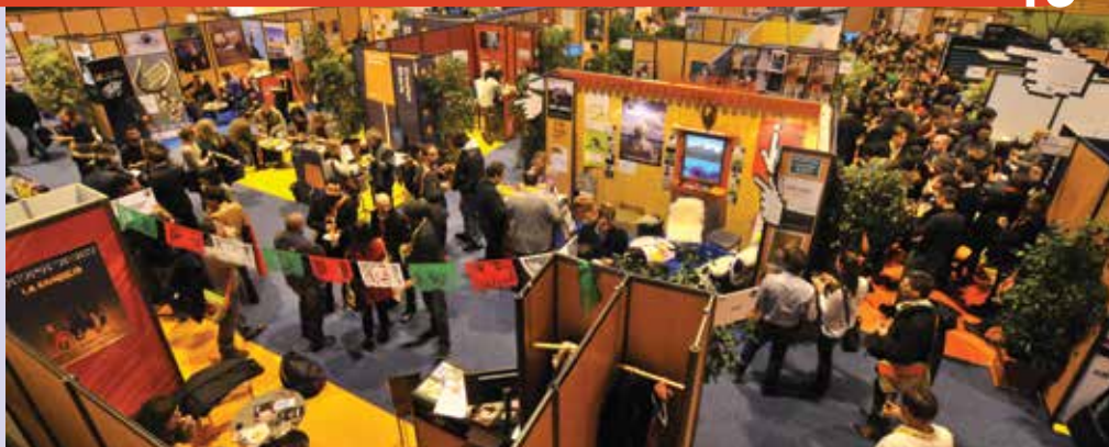
Short Film Market 2014

150 industry professionals are expected for the upcoming edition. Euro Connection is open to producers, broadcasters, distributors, and financiers who are from Europe and have the Market Accreditation. The Pitch Sessions are free, but one must register beforehand (also on the website starting in January). Do so quickly though, as the limited number of seats fill up quickly ●