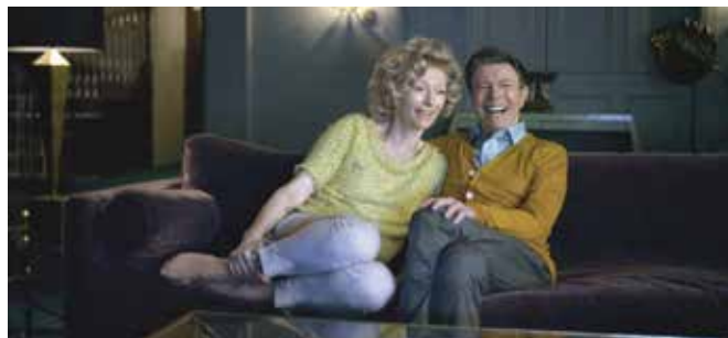
The Stars (Are Out Tonight) de Floria Sigismondi (Etats-Unis - 2013)

Toujours autour de la petite reine, la très courte expo thématique a été mise à Laporte. Dorénavant, elle cherche un autre lieu car la vingtaine de plasticiens du cru sont toujours partants et tous sur la ligne de départ. Œuvres multiples et hétérogènes nous feront goûter les plaisirs croisés de la pédale et de la manivelle.