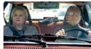
Újratervezés by Barnabás Tóth (Hungary – 2013)

Then saddle up for 3 programmes of cycle therapy! ●