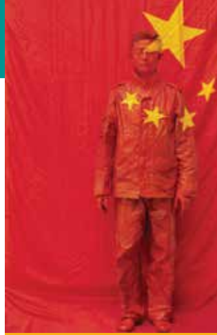
Hide in the city n°26 Front of the Chinese Flag Liu Bolin, 2012

f /Clermontferrandshortfilmfestival @Clermont_Court ou #ClermontFF15