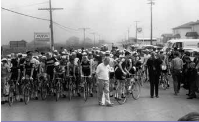
60 cycles by Jean-Claude Labrecque (Canada – 1964) © National Film Board of Canada. All rights reserved.